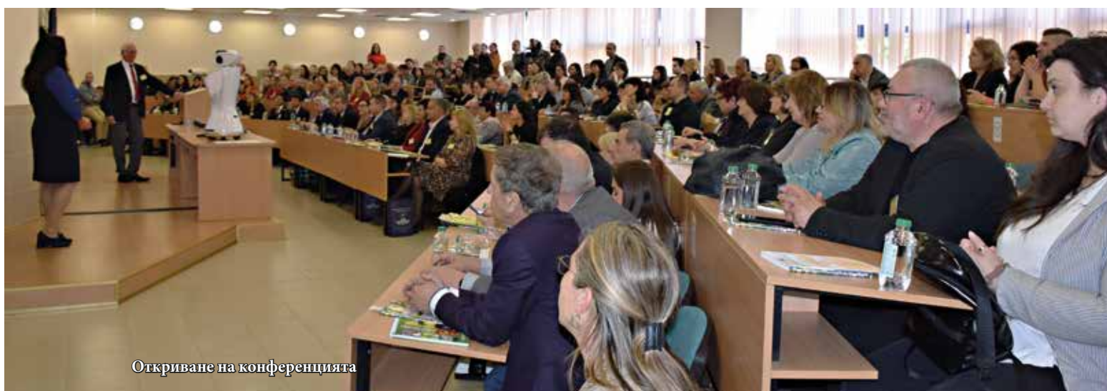
Откриване на конференцията