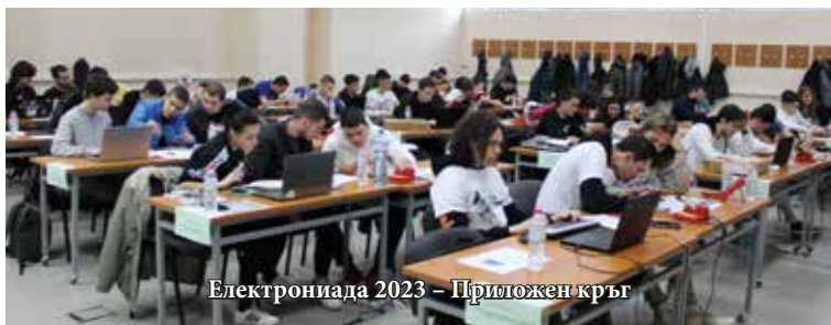
Електрониада 2023 – Приложен кръг

Организатори на Електрониада 2023 са преподавателите и постдокторантите от катедра „Електроника“, факултет „Електротехника, електроника, автоматика“ на Русенския университет.