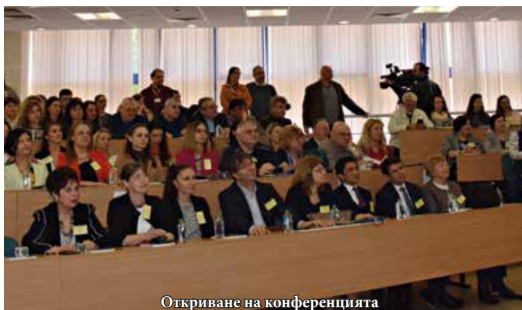
Откриване на конференцията

с грамоти и кристални призове Най-добър доклад следните доклади: