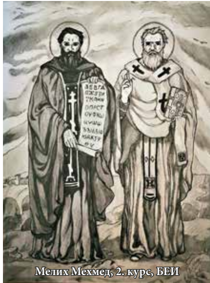
Мелих Мехмед, 2. курс, БЕИ

Из празничното слово на доц. д-р Велислава Донева в навечерието на 24 май пред студенти от спец. Български език и история.