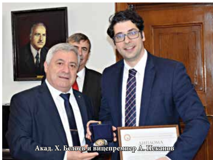
Акад. Х. Белоев и вицепремиер А. Пеканов

На 19 май 2023 г. в Русенския университет бе на посещение вицепремиерът по управление на европейските средства Атанас Пеканов. Той се срещна с академичното ръководство на висшето училище и му беше връчен Кристален знак на Русенския университет.