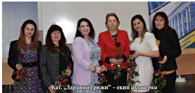
Кат. „Здравни грижи“ – екип акушерки

Поздравления за празника към студентите и преподавателите отправи