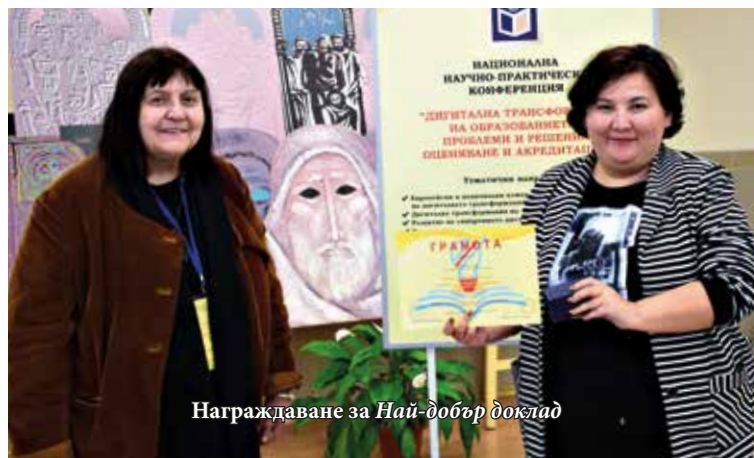
Награждаване за Най-добър доклад