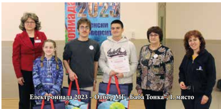
Електрониада 2023 – Отбор МГ „Баба Тонка“, 1. място

Ученическите отбори са: Професионална гимназия по електротехника, Варна (2 отбора); Профилирана природо-математическа гимназия „Екзарх Антим I“, Видин (1 отбор); Неврокопска професионална гимназия „Димитър Талев“, Гоце Делчев (1 отбор); Професионална гимназия по електротехника и електроника „Апостол Арнаудов“, Русе (1 отбор); Математическа гимназия „Баба Тонка“, Русе (2 отбора); Професионална гимназия по механотехника, електроника, телекомуникации и транспорт „Христо Ботев“, Шумен (2 отбора); Иновативно средно училище „Димитър Маринов“, Лом (1 отбор); Професионалната гимназия по компютърно програмиране и иновации, Бургас (2 отбора); Професионална гимназия по земеделие „Стефан Цанов“, Кнежа (1 отбор); Професионална гимназия по механоелектротехника и електроника, Бургас (2 отбора); Средно училище „Васил Априлов“, Долна Митрополия (1 отбор).