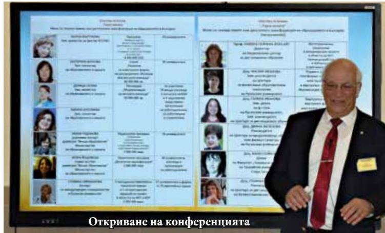
Откриване на конференцията